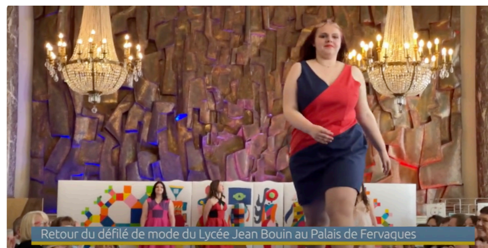
Retour du défilé de mode du Lycée Jean Bouin au Palais de Fervaques

À l'issue de cette recherche, avec ces nouveaux vêtements impliquent pour chacun une tenue particulière, les élèves entreprennent de marcher dans l'espace, de bouger, de s'exprimer avec leur corps. Plusieurs pistes sont possibles, y compris de se lancer dans un défilé de mode, qui permet, à partir d'un espace de jeu délimité, d'aborder les entrées et les sorties de façon individuelle, ou à deux en se croisant ou en marchant.