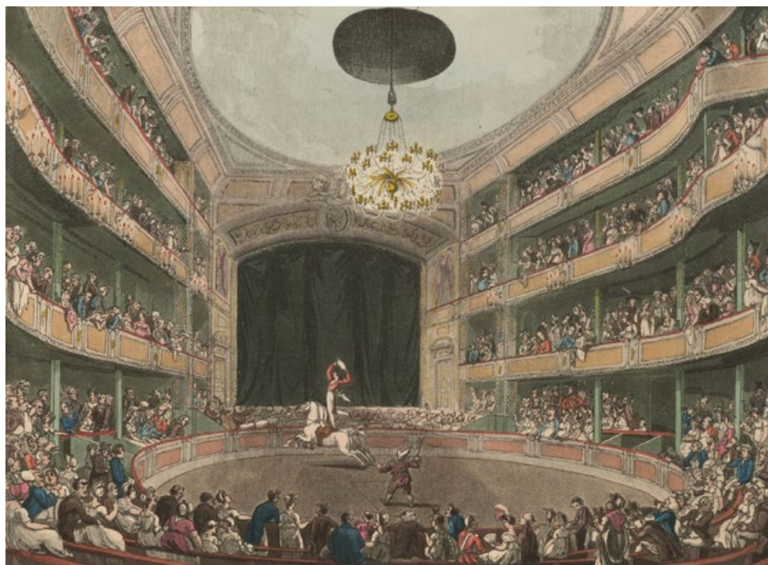
Ci-contre : Astley's Amphitheatre illustration extraite de Microcosm of London, 1808.

D'après le dossier réalisé par Nicolas Monteil pour le Manège de Reims dans Les fondamentaux du cirque et le nouveau cirque : http://www.cndp.fr/crdp-reims/poletheatre/service_educatif/fondamentaux_cirque.pdf