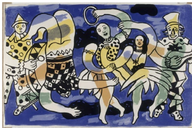
Ci-dessus : Fernand Léger, Album : Le Cirque , 1950 © ADAGP, Paris - Photo © RMN-Grand Palais (musée Fernand Léger) / Gérard Blot

→ Retrouvez sur pearltrees , dans la rubrique